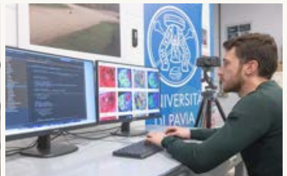
Dipartimento di Ingegneria Industriale e dell'Informazione

La ricerca scientifica ha anche una dimensione di impatto sulla società, sull'innovazione e sullo sviluppo del territorio. Come può l'università rafforzare questo dialogo tra ricerca accademica, imprese e società?