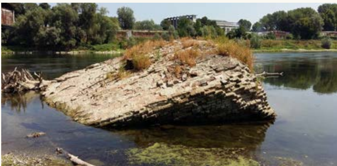
La Torre del Catenone

che partiva dalla stessa torre e raggiungeva una base di aggancio sul lato opposto del Ticino , attraversando quindi l'intero fiume. Lo scopo di questa grandiosa opera era proteggere la città , e soprattutto il suo porto , dall'invasione delle navi nemiche . Il periodo in cui venne utilizzata fu quello della dominazione viscontea e, successivamente, sforzesca. La Torre del Catenone venne distrutta dall'esercito francese durante la famosa Battaglia di Pavia del 1525 .