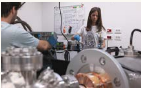
Dipartimento di Fisica 'A. Volta'