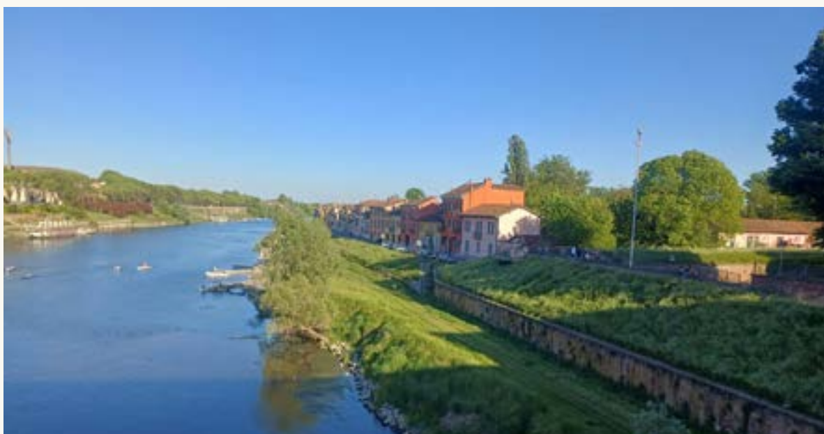
Immagine di Via Milazzo e del Borgo Basso dal Ponte Coperto

La camminata che vi propongo questa volta si chiama Anello del Borgo ed è un bel percorso che ci consentirà di conoscere meglio uno dei quartieri più caratteristici di Pavia, il Borgo Basso di Via Milazzo, e alcune zone circostanti nella campagna e lungo il fiume . La mappa del percorso e una descrizione sintetica sono riportate nel sito Vie Verdi del Ticino , fruibile tramite il link https://natura.parcoticino.it/itinerari/item/355-anello-di-borgoticino.html