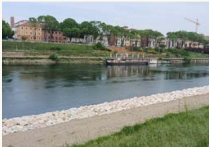
La massiccata per proteggere il quartiere dall'erosione

Questa situazione, divenuta emergenziale, ha reso necessario un intervento di consolidamento e protezione con la messa in sede di massi di grandi dimensioni lungo la riva per contenere il problema.