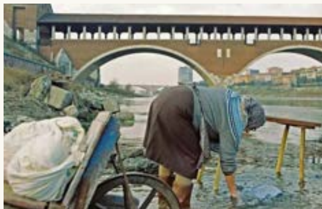
Una lavandaia degli anni '60.

Per protegersi i piedi usavano zoccoli in legno con calze di lana e il banchin , uno sgabello in legno con sponde che doveva ripararle dall'acqua. Gli stivali in gomma sarebbero infatti arrivati solo in tempi più recenti.