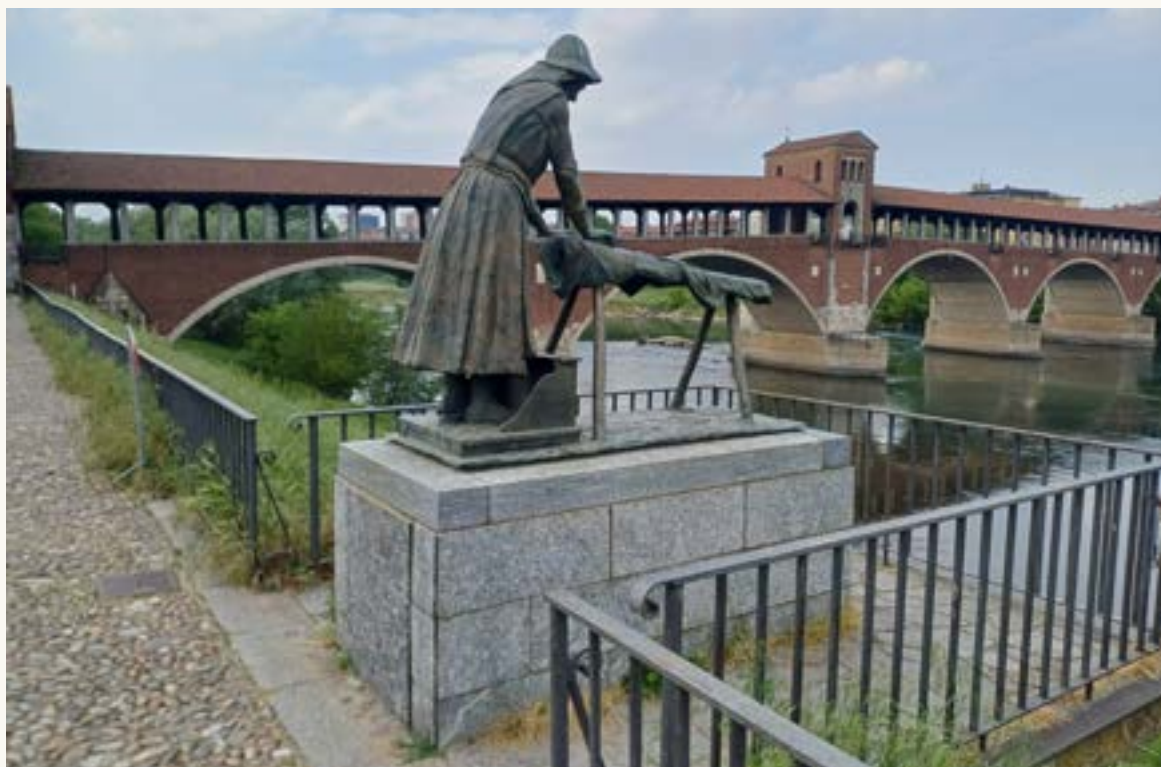
Statua della Lavandaia, realizzata dallo scultore Giovanni Scapolla

Doveroso il monumento in bronzo a loro dedicato, posto in posizione panoramica proprio all'inizio della via, la Statua della Lavandaia , realizzata dallo scultore Giovanni Scapolla nel 1981, e divenuta negli anni un simbolo della nostra città.