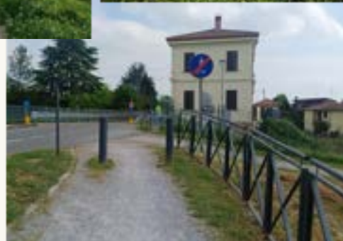
I pioppeti, il fiume Ticino presso l'imbarcadero, la panchina gigante, la Chiavica