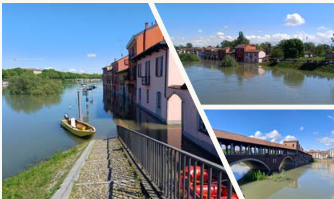
Immagini della recente alluvione dell'Aprile 2025

È noto come la storia del Borgo sia stata condizionata da tante alluvioni che obbligarono la popolazione ad evacuare ogni volta che il fiume esondava; è curioso come la popolazione imparò a convivere con questi fenomeni atmosferici e il quartiere continuò a essere abitato.