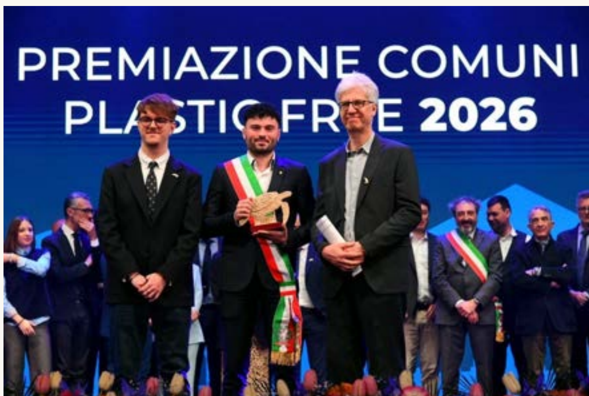
Premiazione Comuni Plastic Free Roma 2026

Viviamo un periodo sicuramente complicato per quanto riguarda il rispetto della "cosa pubblica". Comportamenti incivili irrispettosi dell'ambiente sono all'ordine del giorno. Spesso non si pensa che inquinare il territorio che ci circonda è fare del male in primo luogo a se stessi e alle persone a cui stiamo vicini. I momenti conviviali diventano allora pretesto per "giustificare" la manifestazione della propria libertà, che si traduce però in mancanza di rispetto per gli altri e per l'ambiente che ci circonda.