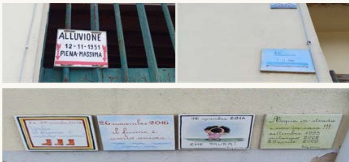
I livelli raggiunti da alcune piene segnati sui muri delle case

precipitazioni, quasi 90 millimetri di pioggia in meno di 24 ore , accompagnate da folate di forte vento. Da notare come l'alluvione fu improvvisa e non prevista dalle Autorità, ulteriore evidenza del problema del riscaldamento globale che ha reso questi fenomeni meno prevedibili.