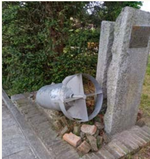
Monumento alle vittime delle incursioni aeree su Pavia

Nei pressi della Statua della Lavandaia potremo vedere un monumento , costituito da una bomba sganciata dagli alleati durante i raid aerei della Seconda Guerra Mondiale nel settembre 1944, a ricordo di una delle pagine più dolorose di Pavia e del Borgo, come tramandato dalle cronache e raccontato anche dai genitori di quelli della mia generazione.