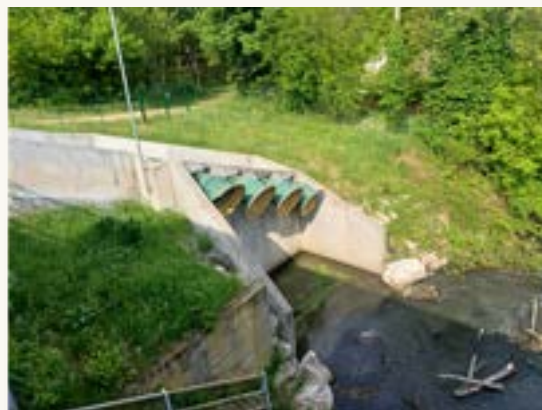
Il canale Gravellone e il "Piccolo Mose"

Proseguiremo quindi la camminata tra campi e pioppeti , fino ad arrivare all' imbarcadero di Travaco , un'accogliente area ricreativa, con panchina gigante posta su un punto panoramico con vista sul Duomo. Da lì potremo proseguire lungo la Via chiamata Costa Caroliana , e gireremo a destra verso Pavia percorrendo le Vie Battella e Chiavica , lungo un percorso ciclopedonale posto sull'argine che costeggia in parte il canale Gravellone e che separa la zona golenale dai campi.