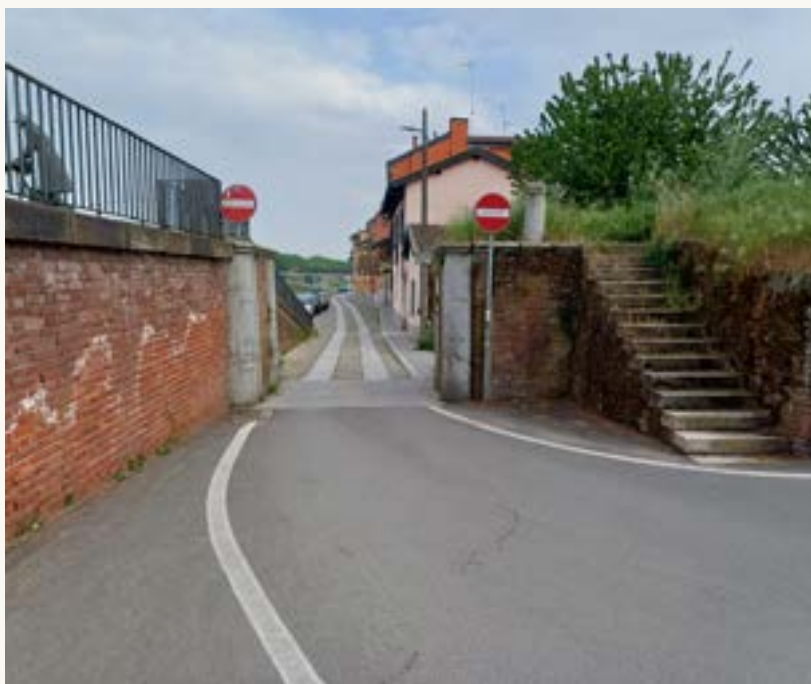
Ingresso di Via Milazzo

È un quartiere che per secoli ha avuto una vita propria rispetto alla città, dove viveva una comunità operosa che parlava persino un dialetto un po' diverso da quello pavese vero, per esempio, per dire "io" si usava il famoso "mei" invece di "mi".