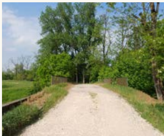
Il sentiero verso l'imbarcadero

Proseguendo la nostra camminata, arriveremo al ponte che attraversa il canale Gravellone , altro punto di interesse storico in quanto questo canale rappresentava il confine di Stato tra il Regno Lombardo-Veneto e il Regno Sardo-Piemontese sino alla disfatta austriaca del 1859.